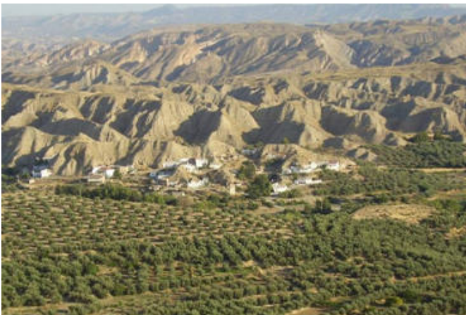
La Comarca desde el cielo

Sobre los acuerdos tomados en esta sesión, cabe destacar que a finales de enero, se instará a otros Patronatos Andaluces a su participación en este proyecto, a través de la Asociación Vuelo Libre de Andalucía.