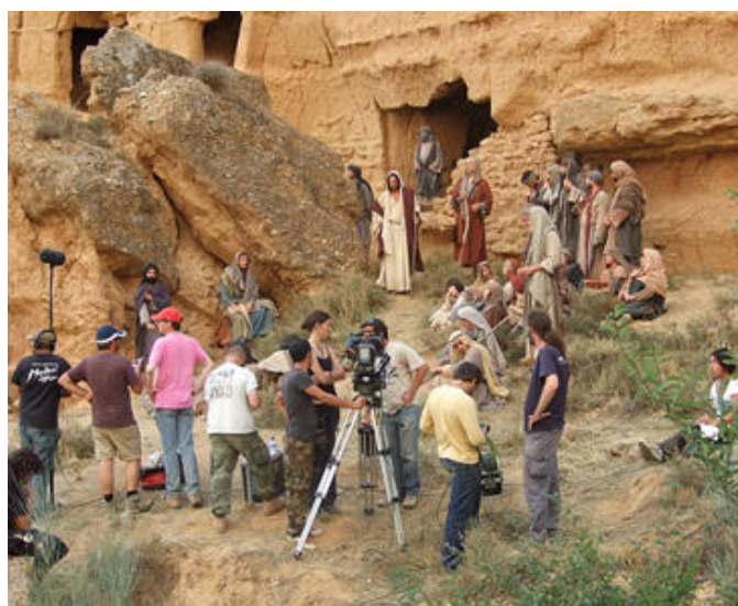
Rodaje de El Discípulo