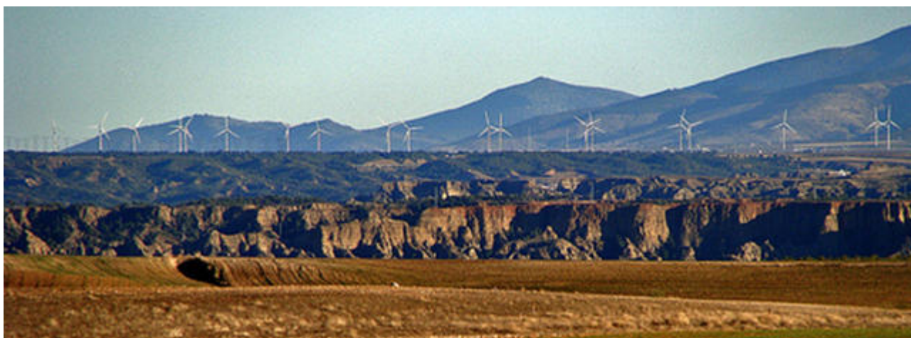
Imagen de la Comarca en Miradas de Andalucía

Este apasionante viaje por la Comarca de Guadix puede ser consultado en la web: http://www.miradasdeandalucia.es