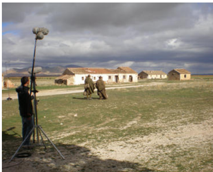
Rodaje de La Mula

Además de los recursos directos que genera ser escenario de una producción audiovisual existen una serie de beneficios intangibles como la repercusión turística hacia el lugar, de hecho parte de los lugares protagonistas de clásicos del cine rodados en la comarca Guadix se incluirán en la “Gran ruta del Cine por Andalucía”, proyecto realizado por Andalucía Film Commission con el apoyo de la Consejería de Turismo, Comercio y Deporte.