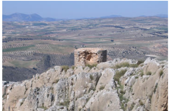
Área de vuelo libre El Mencil (Pedro Martínez)