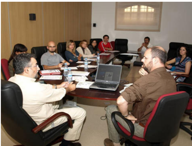
Reunión de coordinación Proyecto Trogloditismo Vivo

Por último destacar la creación de un germen de asociación en el sector empresarial turístico, que, aunque de manera desigual según territorios, ha tomado conciencia del trogloditismo como recurso y comenzado a trabajar de manera conjunta en la creación de redes y clubes de producto turístico. Dicho grupo de trabajo reunirá a empresarios de las distintas zonas participantes.