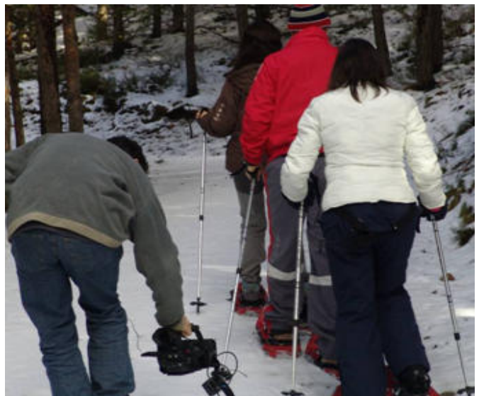
Imagen del Puerto de la Ragua, programa emitido el 26 de diciembre de 2009

Destino Andalucía se emite los sábados a las 14:00 horas en Canal Sur Televisión.