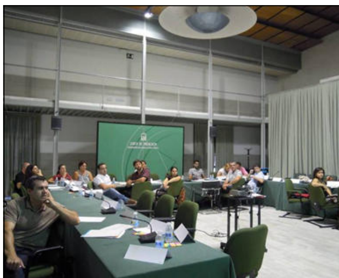
Exposiciones y trabajo en grupos.