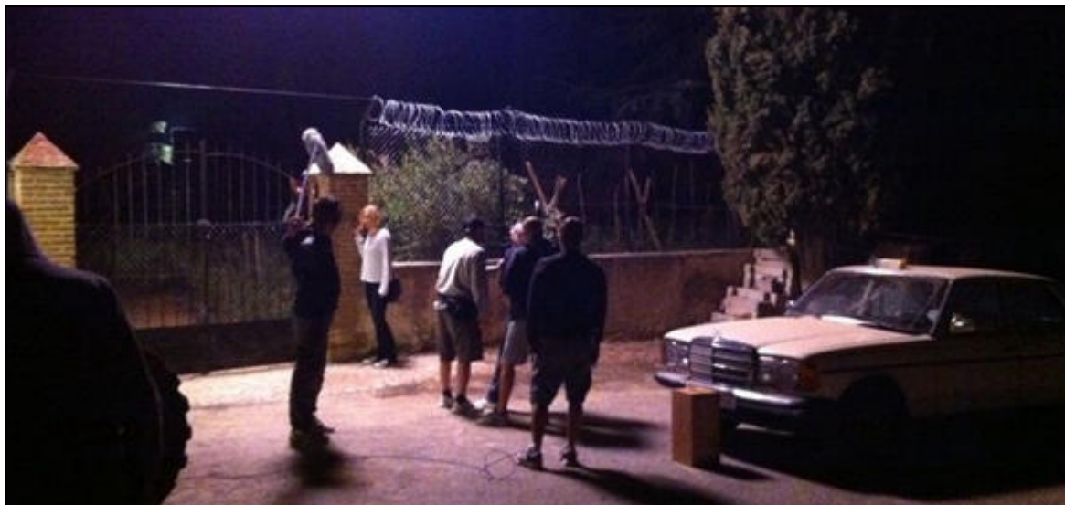
Momento del rodaje "Un lugar en el sol"