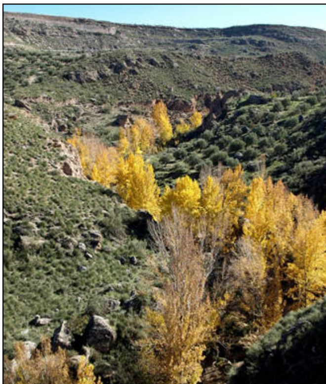
Cauce del Río Gor en las Hoyas del Conquin.

Las Jornadas Europeas de Patrimonio recorrerán nuestra provincia todos los sábados, desde el 15 de octubre hasta el 5 de noviembre, ambos incluidos.