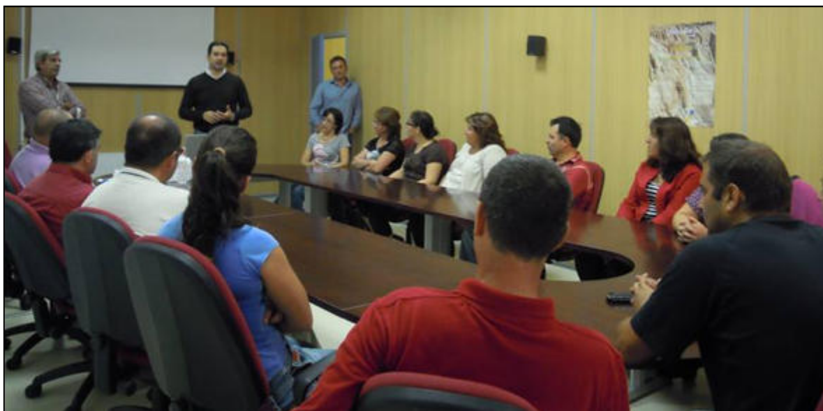
Momento del acto de inauguración del Programa Formativo Elaboración de queso y economía de la empresa quesera

General de Desarrollo Sostenible del Medio Rural, de la Consejería de Agricultura y Pesca de la Junta de Andalucía y cofinanciados por la Unión Europea a través de los fondos FEADER.