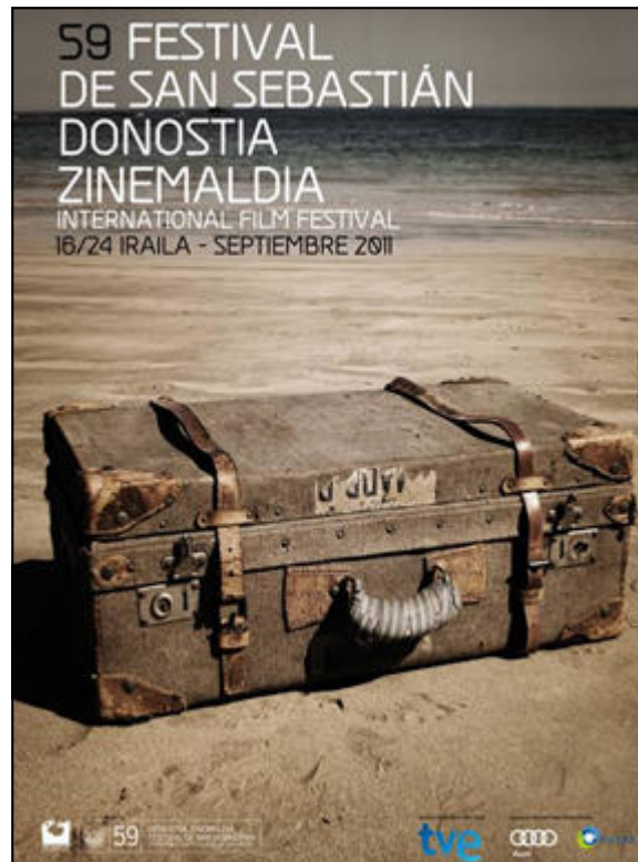
Cartel del 59 Festival de San Sebastián

Comarca de Guadix Film Office (entidad gestionada por la Asociación para el Desarrollo Rural de la Comarca de Guadix) se creó el pasado 4 de mayo de 2009 con el objetivo principal de promocionar las potencialidades de la Comarca como localización para todo tipo de obras audiovisuales y atraer así el mayor número de rodajes a la Comarca. Además, ofrece información, asesoramiento y asistencia gratuita en materia de localizaciones, permisos o servicios a las productoras de cine, video y televisión que deciden rodar en la zona.